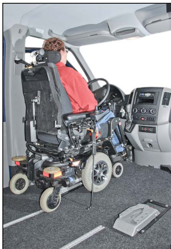
Bundsænkning kan laves i begge sider. Her med dockingstationer. Ofte bruger vi Handi Secure. I begge tilfælde gælder det om at være godt spændt fast.