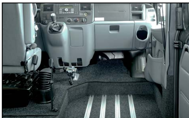
Bundsænkning i passagersiden, her med Handi Secure.